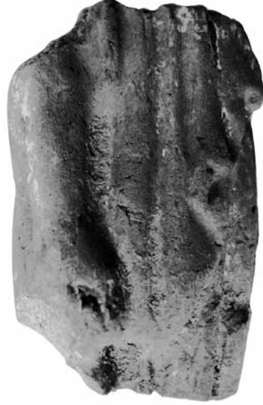
Fig. 6 TK6 Elinde Domuz Adağıyla Ayakta Duran Peplophoros