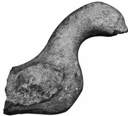
Fig. 10 TK10 Sukuşu