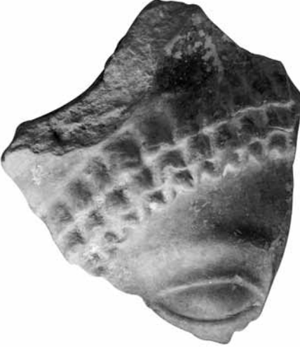
Fig. 3 TK3 Protom, Tip II a. Alın saçları üç sıra zikzak dalgalı