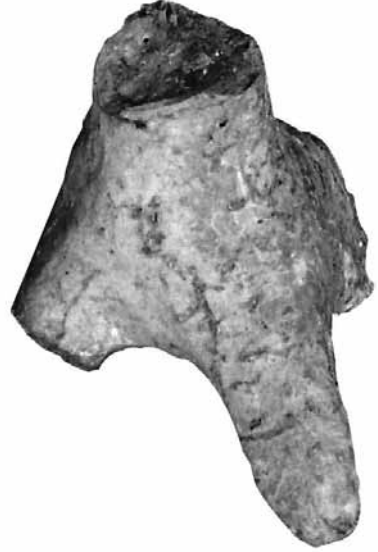
Fig. 12 TK12 Köpek