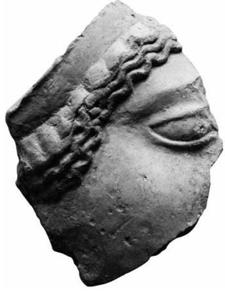
Fig. 4 TK4 Protom, Tip II b. Alın saçları üç sıra ince serbest dalgalı