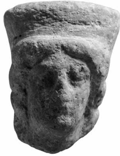
Fig. 8 TK8 Poloslu Kadın/Tanrıça Başı