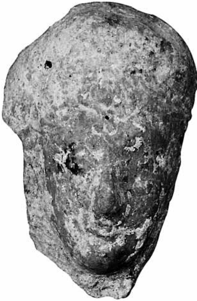
Fig. 9 TK9 Erkek Başı