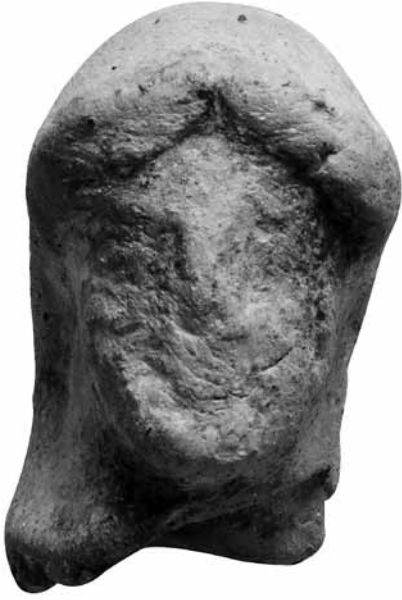
Fig. 7 TK7 Pepliphoros Başı