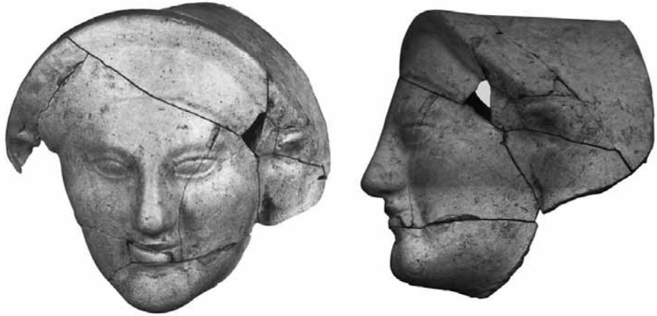
Fig. 2 TK2. Protom, Tip I. Yalın stil, saçlar görünmez