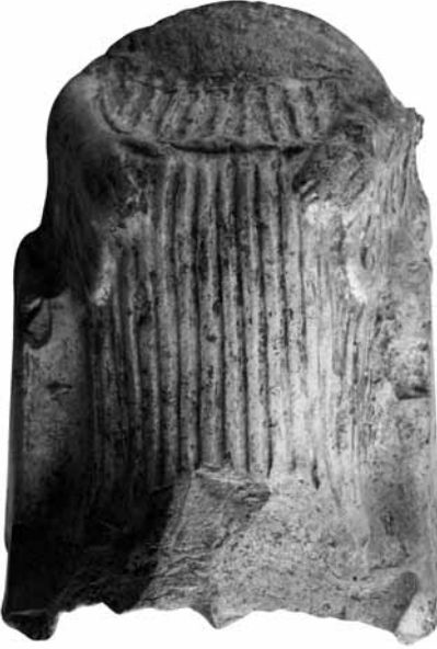
Fig. 5 TK5 Oturan Kore/Tanrıça